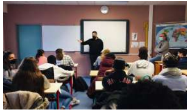
Des entrepreneurs sont venus témoigner devant les collégiens de Buxerolles.

tance des enseignements », trois sujets débattus au regard de l'histoire personnelle de chacun.