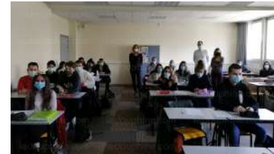
La rencontre entre chef d'entreprise et les étudiants en BTS a été source d'inspiration.

Destiné aux jeunes de 13 à 25 ans, le concept repose sur les témoignages d'entrepreneurs désireux de partager leurs expériences. ■